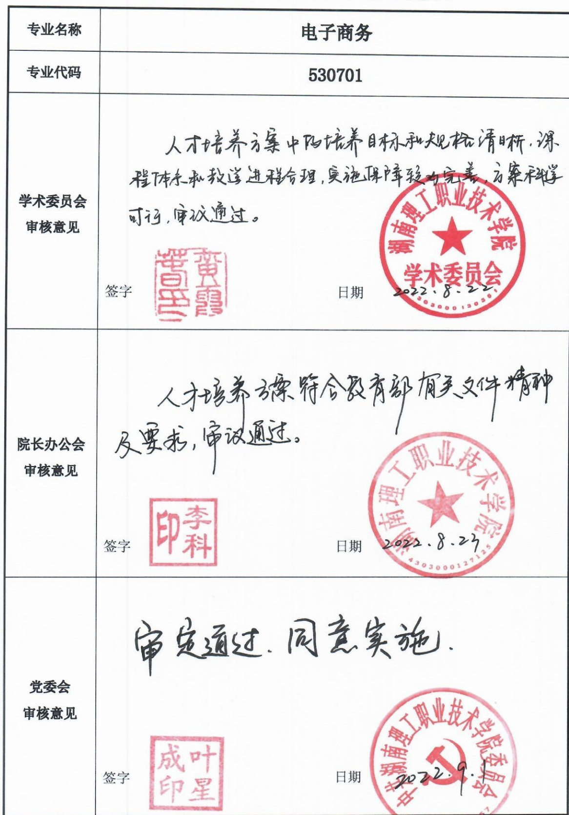
2022 级专业人才培养方案审定表