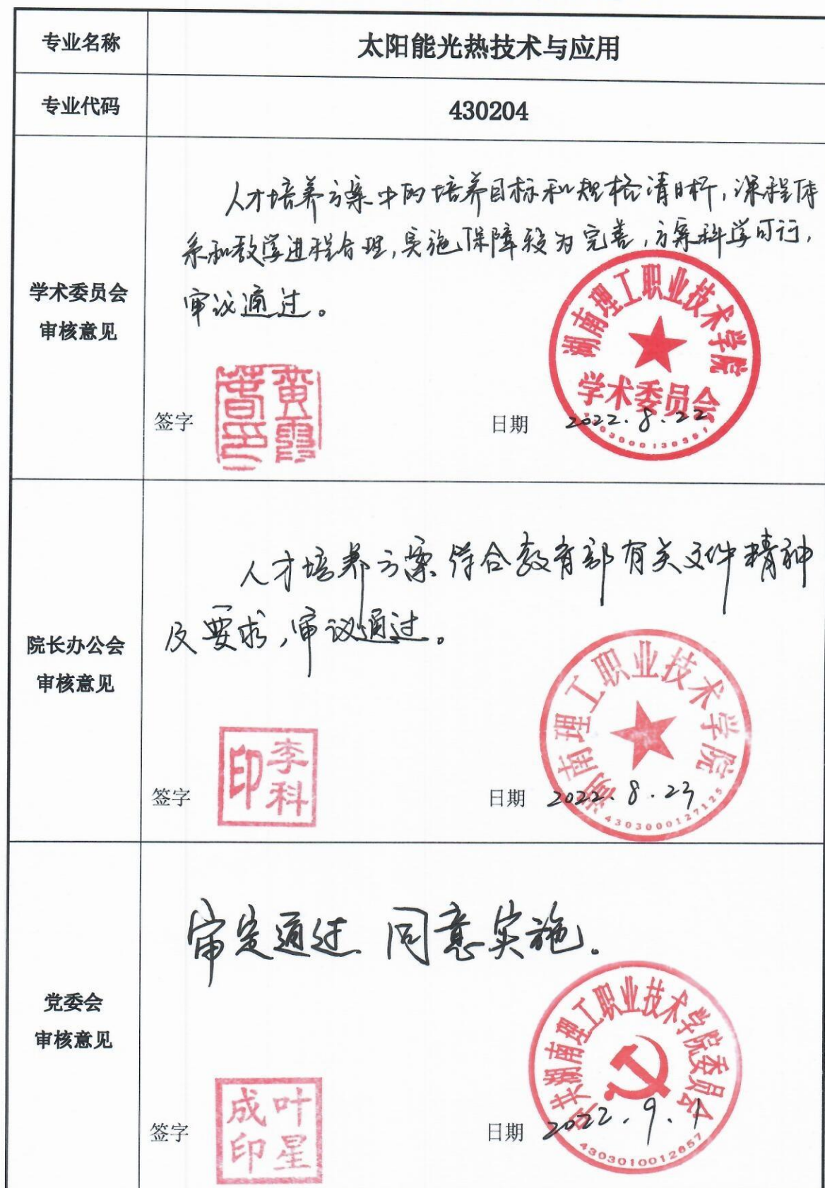
2022 级专业人才培养方案审定表